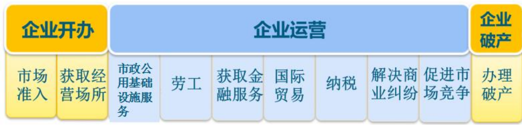
图 I.3B-READY 项目的指标