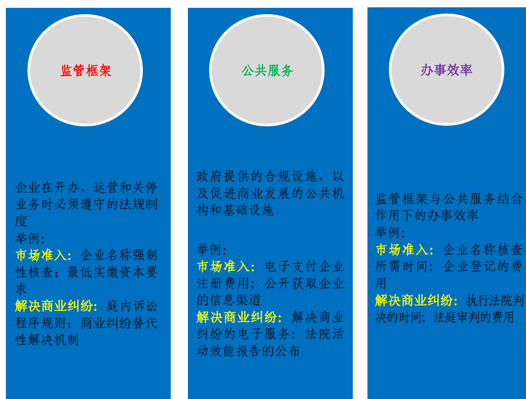
图 1.2B-READY 项目评估企业和市场的监管框架、公共服务和办事效率

B-READY 从监管框架、公共服务和办事效率开展评价。具体含义为：监管框架包括企业在开办、经营和关停时必须遵守的法规制度。公共服务包括政府直接或委托民营企业间接提供的促进企业遵守法律法规的设施、以及促进企业发展的服务机构和基础设施。本项目涉及的公共服务仅限于与企业全生命周期内经营相关的营商环境领域，具体可参见下图。办事效率指的是监管框架和公共服务如何在实践中结合以提升企业效益。